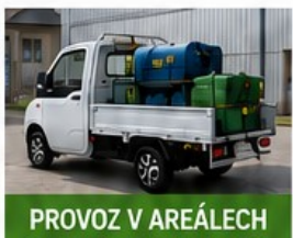
PROVOZ V AREÁLECH