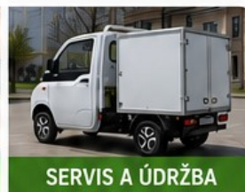
SERVIS A ÚDRŽBA